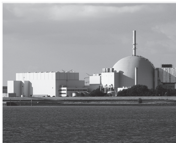
Centrale nucléaire de Brokdorf qui fonctionne en mode de suivi de charge.

Les centrales nucléaires en France et en Allemagne fonctionnent en mode de suivi de charge et participent donc au réglage de fréquence primaire et secondaire du réseau. Certaines unités suivent un programme de charge variable, avec un ou deux changements de puissance importants par jour, comme indiqué dans les figures 1 et 2.